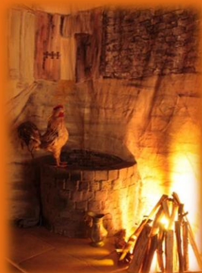
Verleugung des Petrus